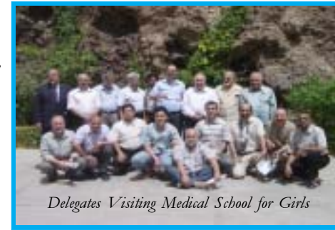
Delegates Visiting Medical School for Girls

4- أقام المهندسون من تلك المؤسسات محطات استخراج وضخ المياه النظيفة.