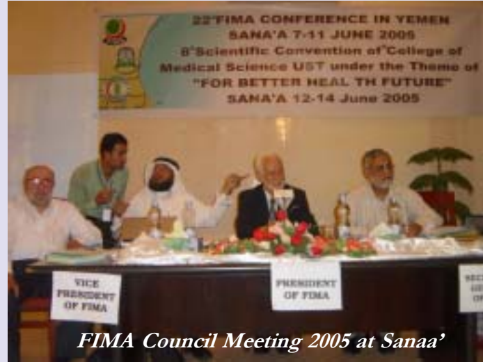
FIMA Council Meeting 2005 at Sanaa'

Sanaa' – Yemen, 9 th and 10 th June 2005 by : Prof. M Tariq ariqueuro@hotmail.com