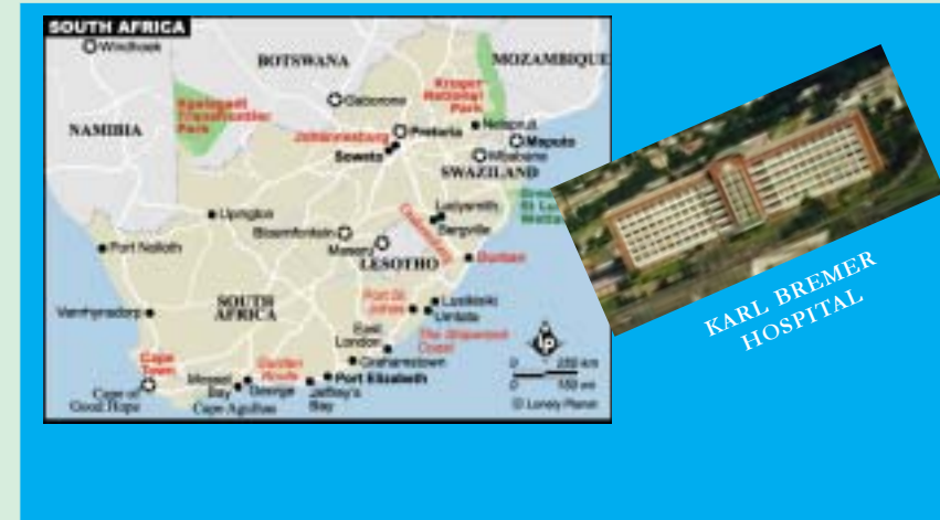
KARL BREMER HOSPITAL

أعلنت المؤسسات الثلاث عن إنشاء هيئة واحدة لتنسيق وتوحيد أنشطتها.