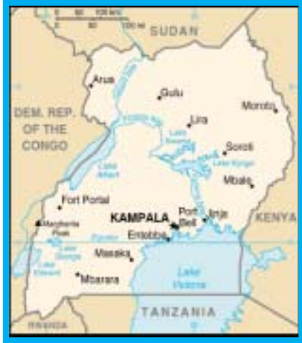
Map of Uganda